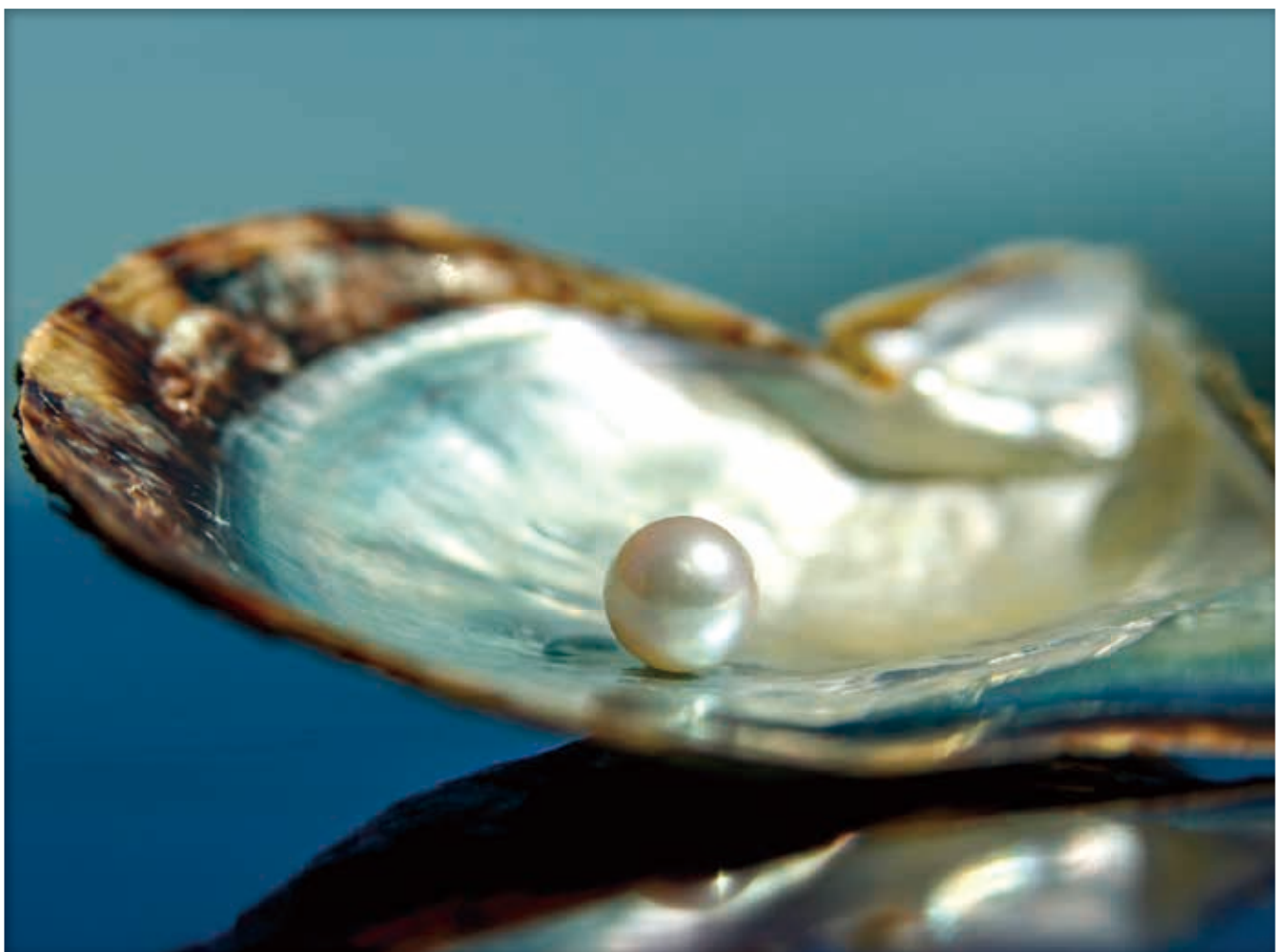
アコヤガイと真珠