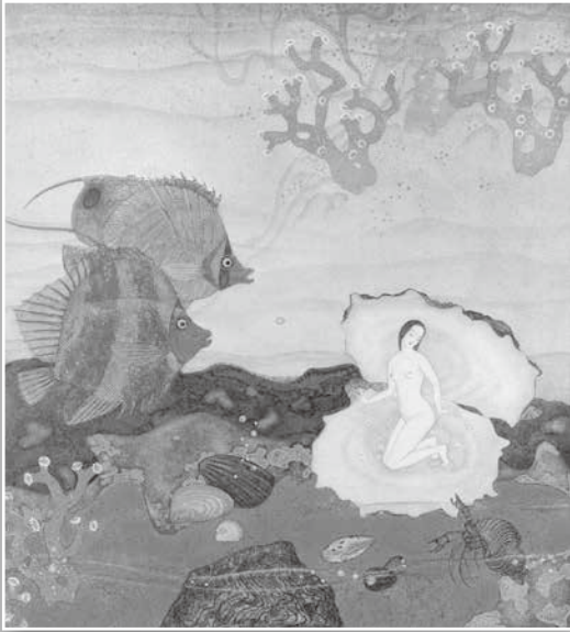
エドモンド・デュラック「真珠の誕生」 レオナルド・ローゼンタール『真珠の王国』より（真珠博物館所蔵）