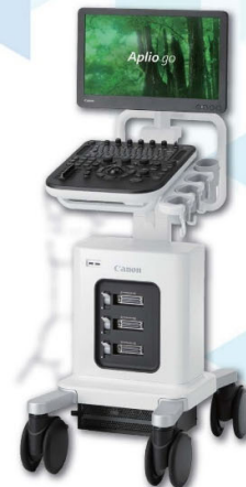
Aplio go / LE

医療機器認証番号： 306ACBZX00021000 製造販売元： キヤノンメディカルシステムズ株式会社